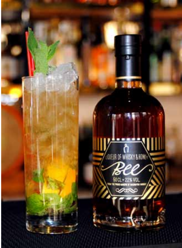
Whisky- och honungslikören Bee ingår sedan den 2 september i 80 av Systembolagets butikers ordinarie sortiment.