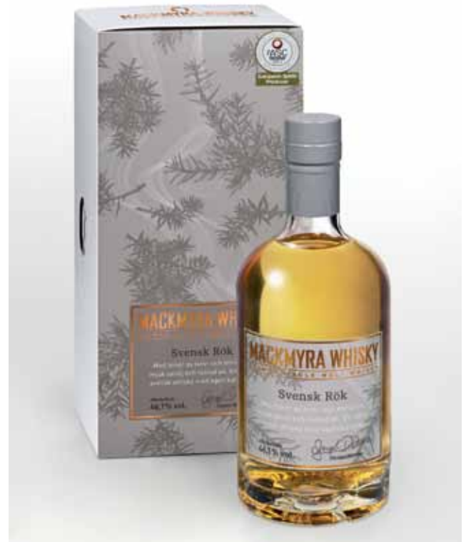
Svensk Rök lanseras den 2 september och blir den första rökiga svenska whiskyn i Systembolagets ordinarie sortiment.