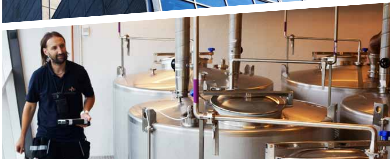
Destilleriet i Mackmyra Whiskyby är nu i full gång och stod för all destillering under det andra kvartalet.