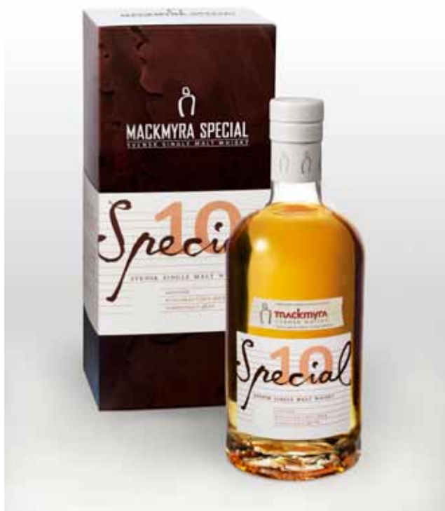
Special:10 - Kaffegök blev en framgångsrik avslutning på specialserien.